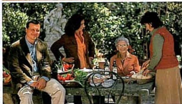
天気の良い日は庭でランチが楽しい。自家製の野菜や果物も盛りだくさん!

実家のオリーブ畑で「収穫期には初搾りのオリーブオイルのお祝いをするのが楽しみ。オーガニックオリーブオイルがベースのナチュラルコスメグッズたち「オリヴェーティ」でリラックスもはかる