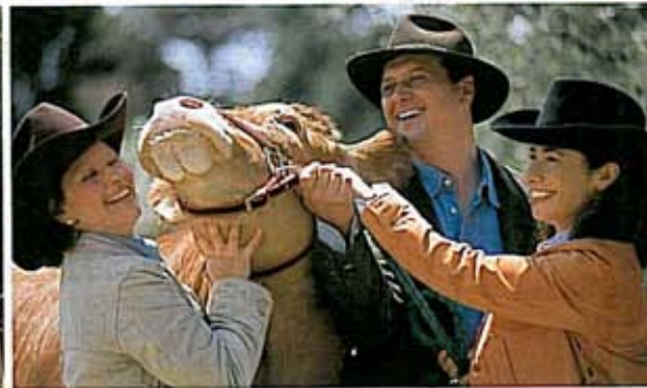
兄のチェザレ夫妻と。牛や羊も飼っている、のどかな農園。